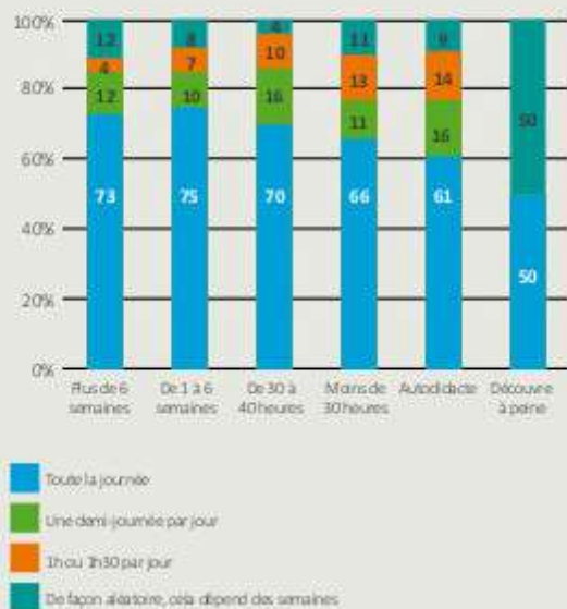
Poids de la pédagogie Montessori dans la journée en fonction de la formation des enseignants (455 répondants)