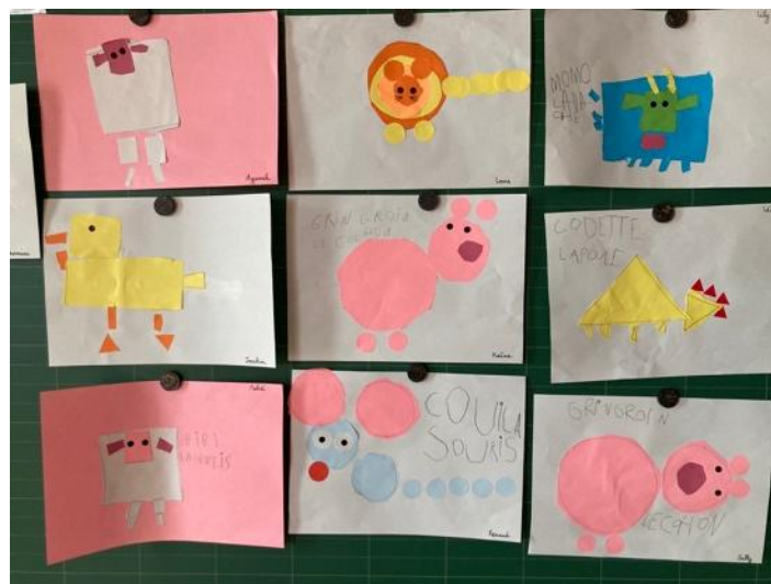
Photo d'une production d'élève